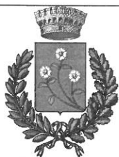
Comune di Roseto Capo Spulico