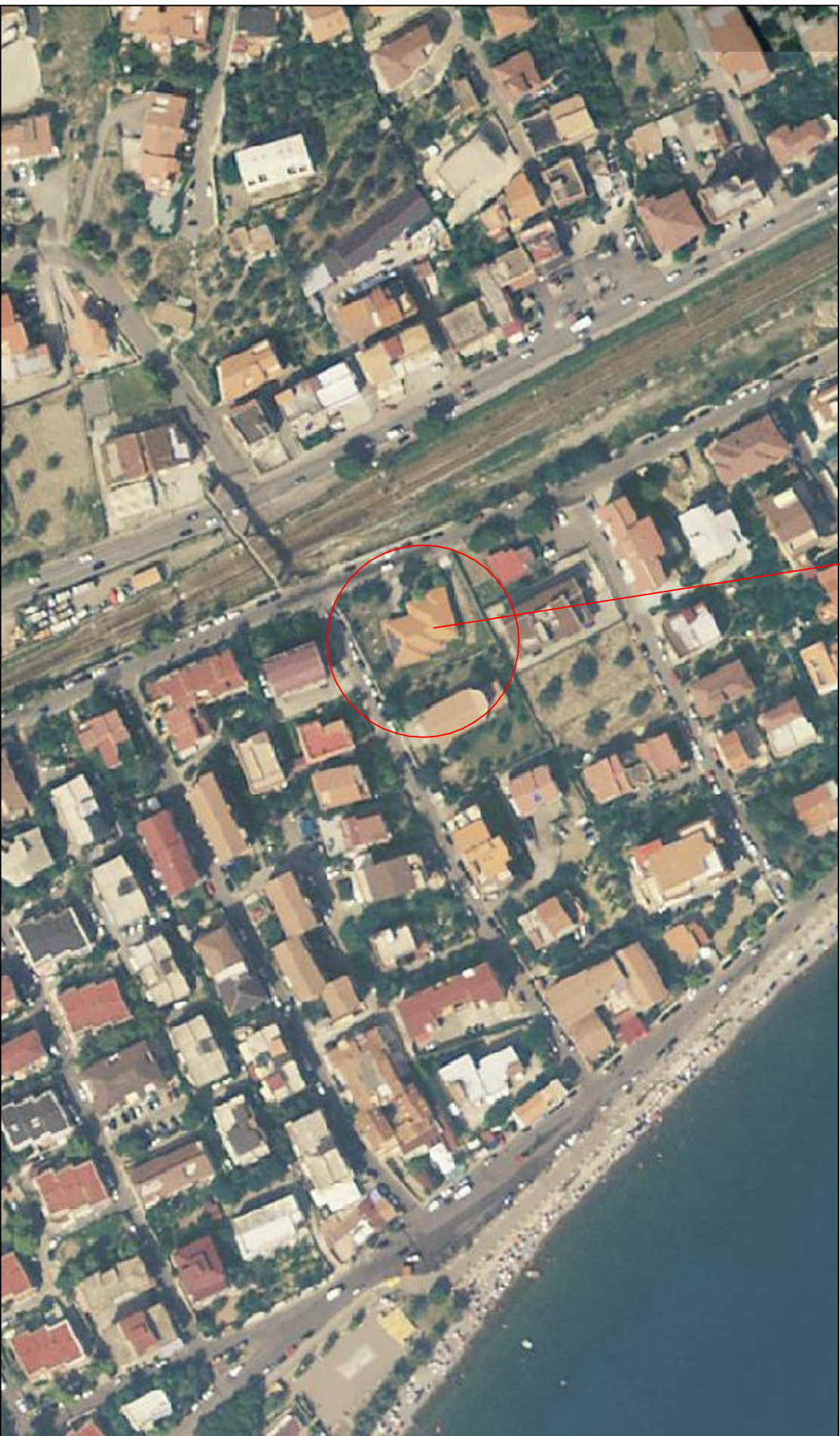
scuola oggetto di intervento scala 1.2000